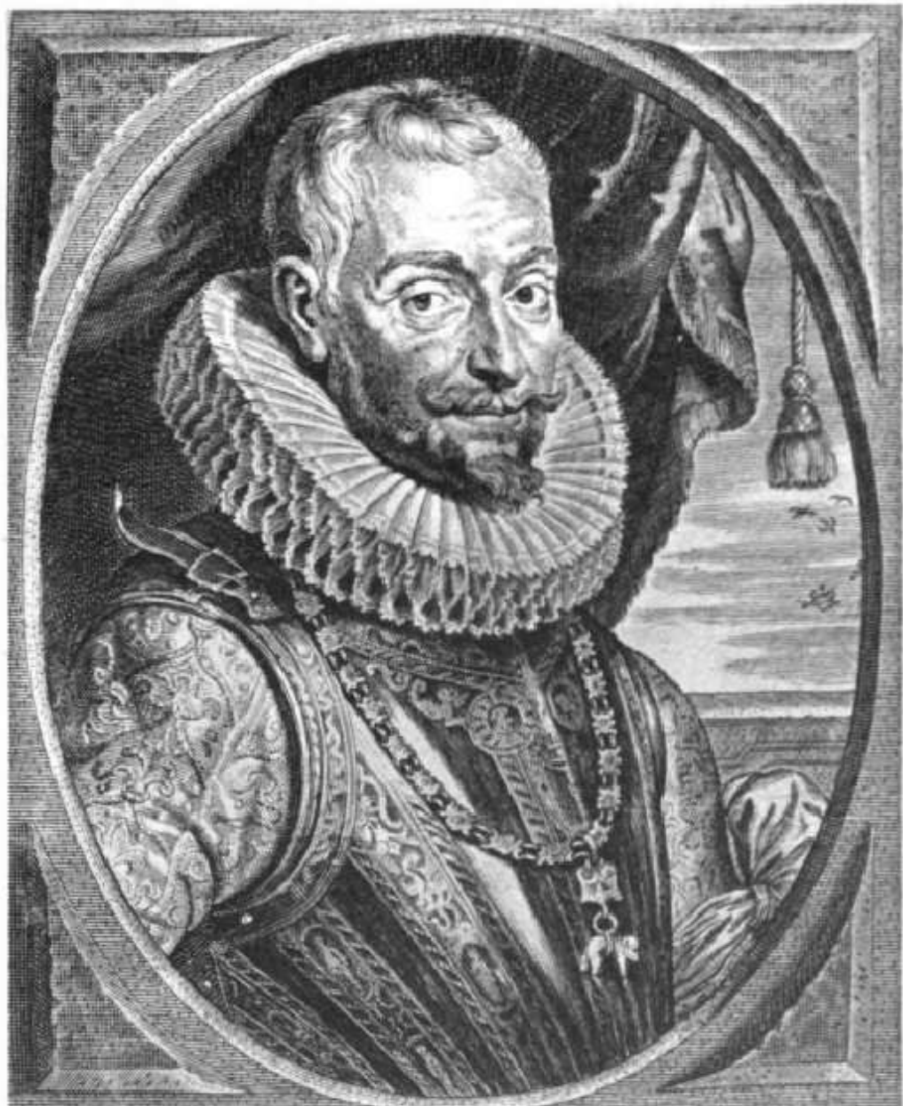
ILLVSTRISSIMVS PRINCEPS AMBROSIVS SPINOLA, MARCHIO SESTII ET VENAFRI, DVX SANSEVERINVS EQVES AVREI VELLERIS ETC. P.P. Rubens pinx. J. de Tede sculp. ex